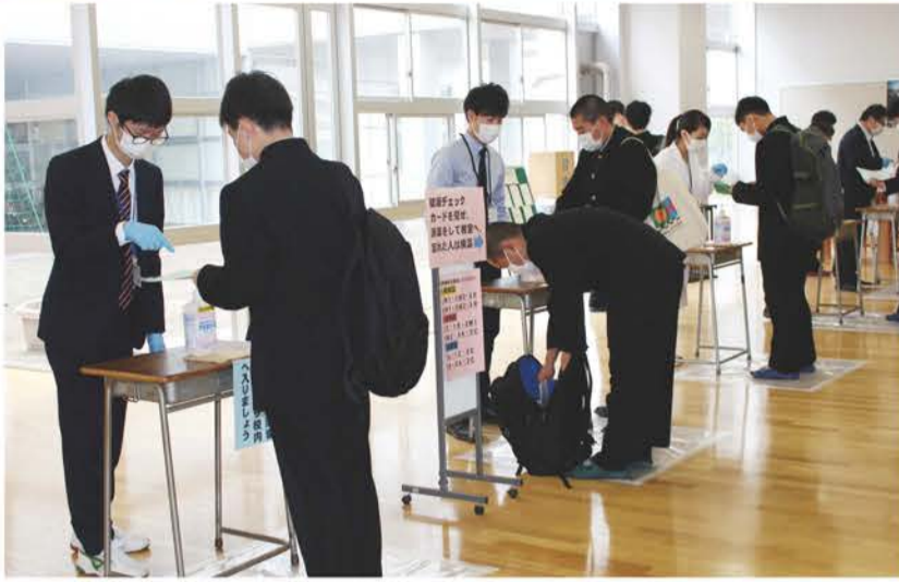
健康チェックを受ける生徒