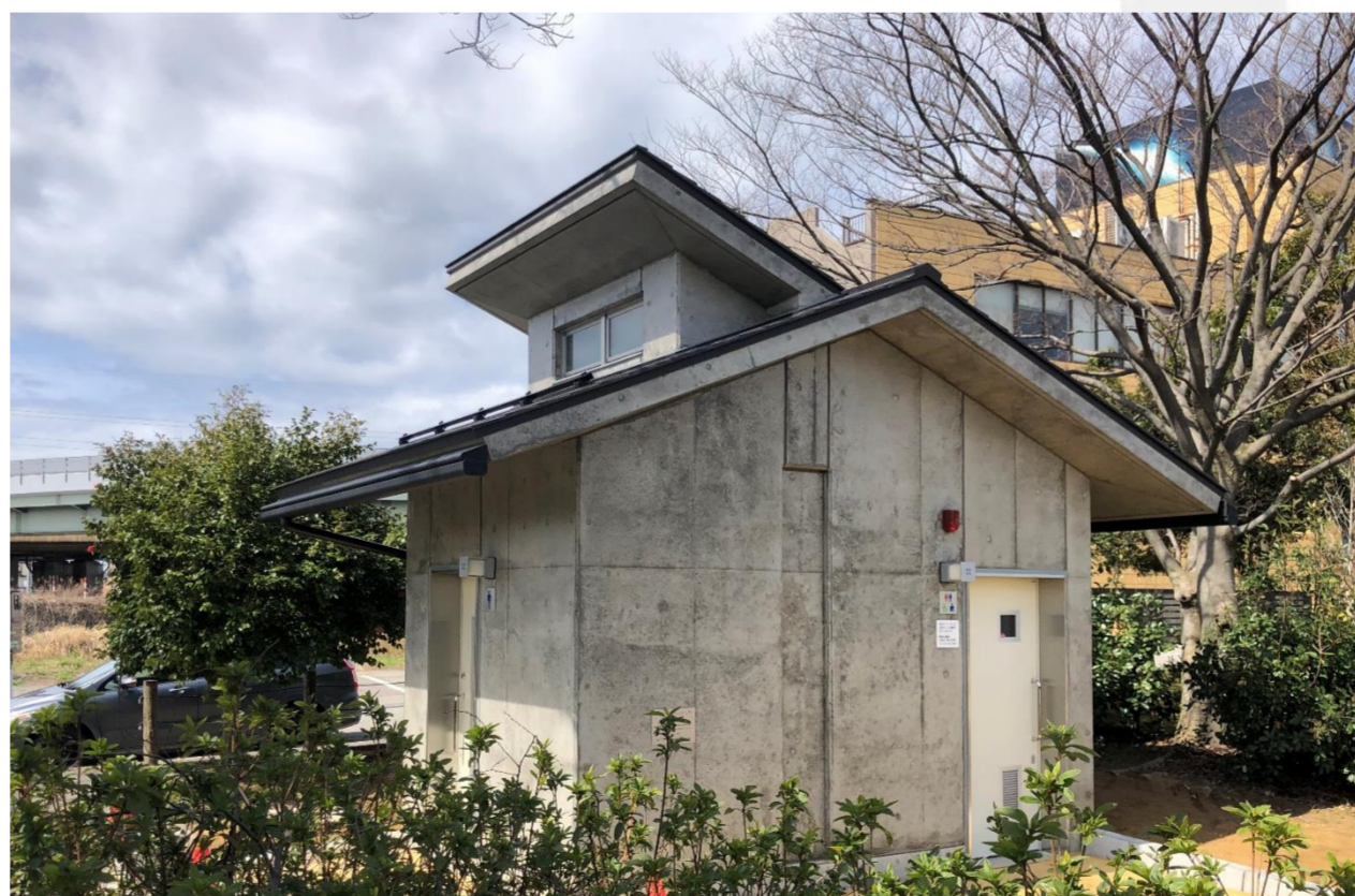
デザインアワード【実現したデザイン】