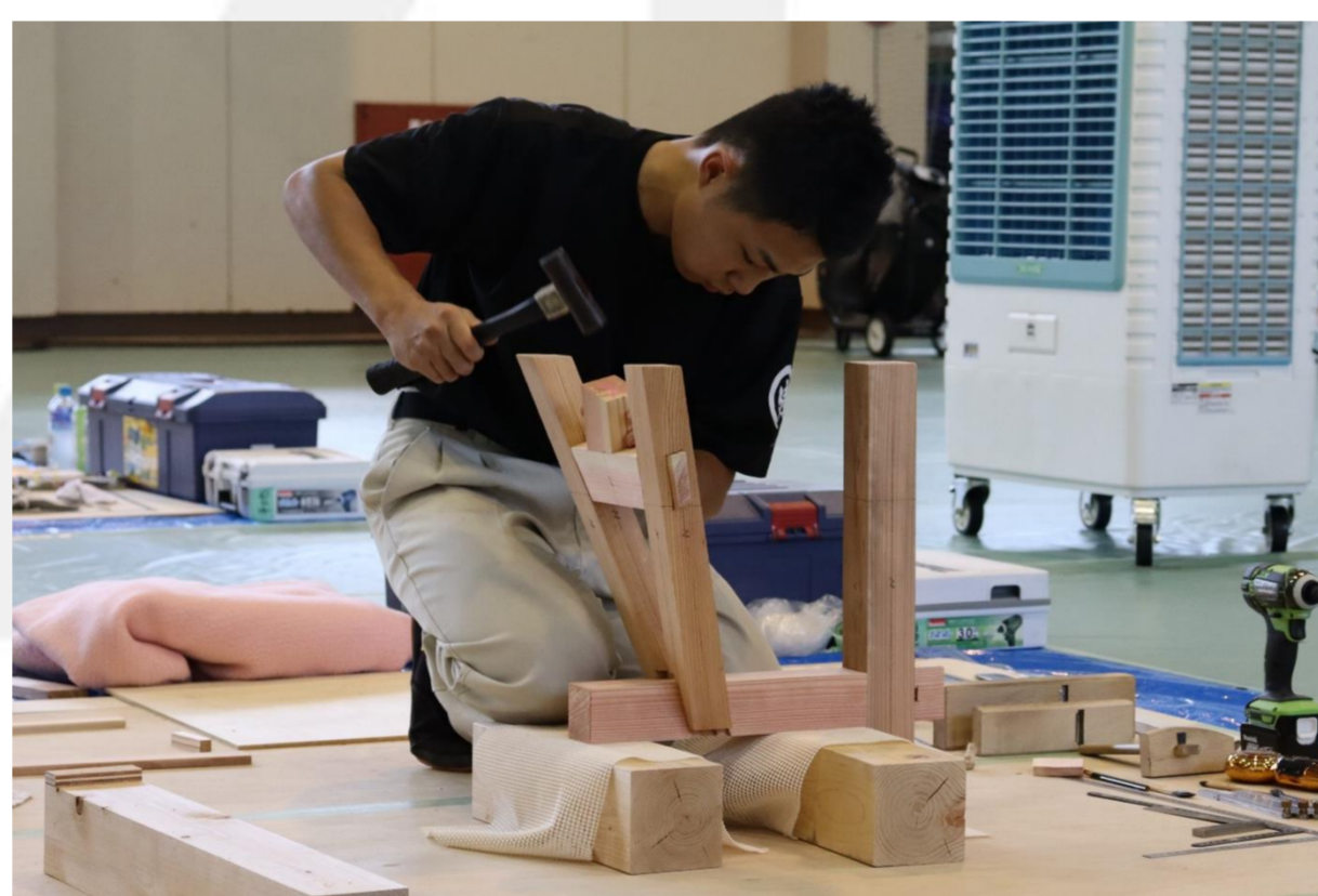
ものづくりコンテスト